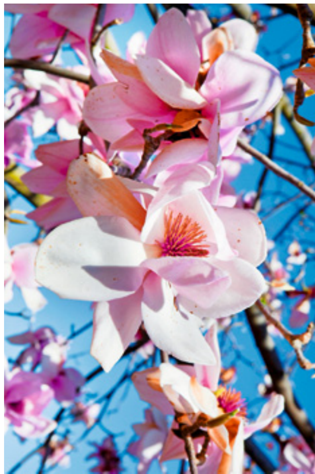
Prachtvolle Blüten: Magnolia Vairano .