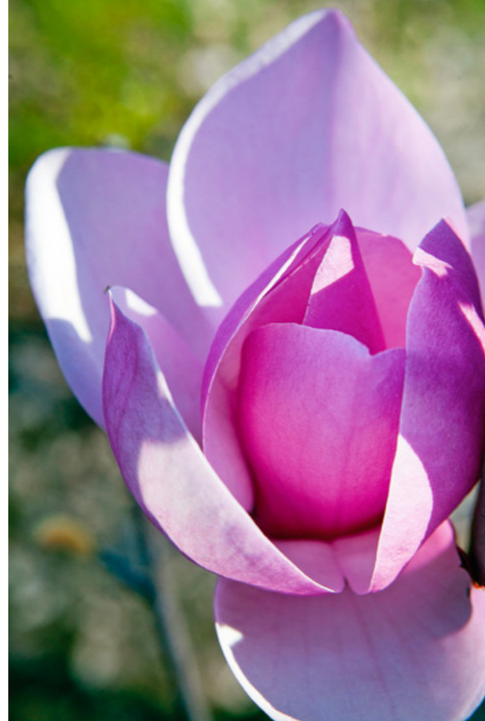
Intensives Dunkelrosa: Magnolia Apollo .

Otto Eisenhuts Blick schweift in die Ferne. Gebückt und sichtlich müde steht er da. Schmerzende Kniescheiben, verschlissen von der Arbeit an den steilen Hängen, und eine Diabeteserkrankung